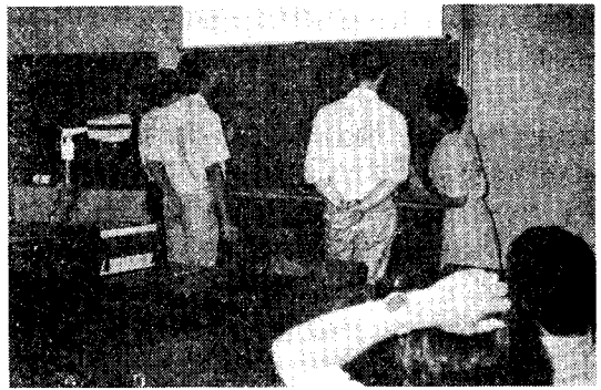
なごやかな雰囲気の中で行われる日本語教室

なことがあっては、すべての努力が無になりかねない。とりあえず、毎年 10 名程度の留学生を受け入れることから始めようということになり、文部省に国費奨学生の採用をお願いした。発展途上国における土木技術者の果たす役割の重要性を理解して頂き、優秀な学生を推薦するという条件のもとで、東京大学の土木工学専門課程が推薦する 10 名の学生に、文部省の奨学金をつけて頂くことができるようになった。博士の場合、少なくとも 3 年在学する必要があるので、毎年 10 名受け入れるとすれば、常時 30~40 名の留学生在学することになる。博士課程に在学する日本人学生は 1 学年平均 5 名程度で、合計でも 15 名前後であるので、博士課程に限れば留学生の数が日本人学生の 2~3 倍になることになる。